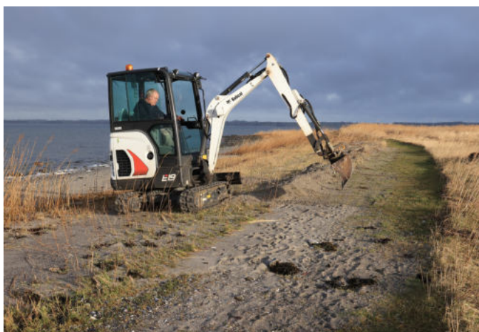
Oprydning på stranden efter stormen Malik

I 2022 har vi brugt ca. 12.000 kr fra beredskabsfonden til oprydning på stranden efter stormen Malik, som ramte 29. januar. Vi sparer løbende op i beredskabsfonden til at imødegå uforudsete udgifter i forbindelse med ekstreme hændelser, som højvande eller kraftig blæst.