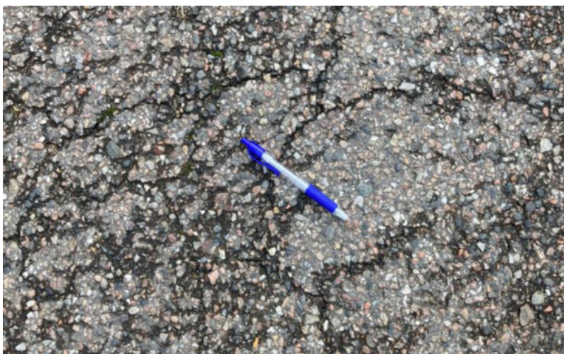
Nærbillede af krakeleret overflade på asfalten

Med det foreløbige budget frem til 2031 forventes det, at planen kan realiseres uden kontingentstigninger, eller ekstra bidrag.